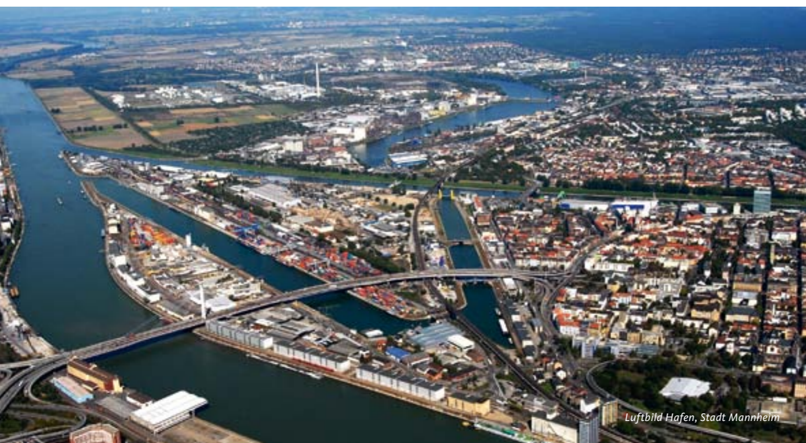
Luftbild Hafen, Stadt Mannheim

Zu den bereits umgesetzten und wichtigsten Empfehlungen des Innovationsrats gehört das Sofortprogramm zur Beschäftigung von Absolventen aus den MINT-Fächern (Mathematik, Informatik, Naturwissenschaften und Technik) im Wissenschaftsbereich . Darüber hinaus wurde im Jahr 2009 über eine Innovationsoffensive für wirtschaftsnahe Forschungseinrichtungen beschlossen, die der baulichen Sanierung und Erweiterung sowie der Modernisierung der apparativen Ausstattung von Institutsgebäuden dient. Die Offensive umfasst für die Jahre bis 2016 ein Volumen in Höhe von 145 Mio. Euro (Mittel aus dem Landeshaushalt) , die mit den dafür vorgesehenen Bundesmitteln Sonderinvestitionen mit einem Gesamtvolumen in Höhe von 235 Mio. Euro ermöglichen .